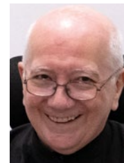
PAUL FRANCIS SPENCER, CP

Nel 250° Anniversario della sua Morte Santi Giovanni e Paolo, Roma, 24-26 settembre 2025