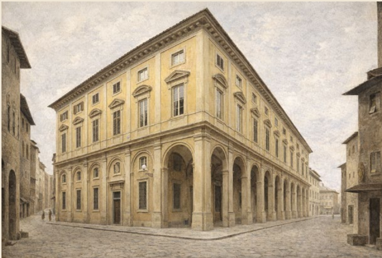
Ex ospedale di San Giovanni Battista, detto di Bonifacio o Bonifazio.