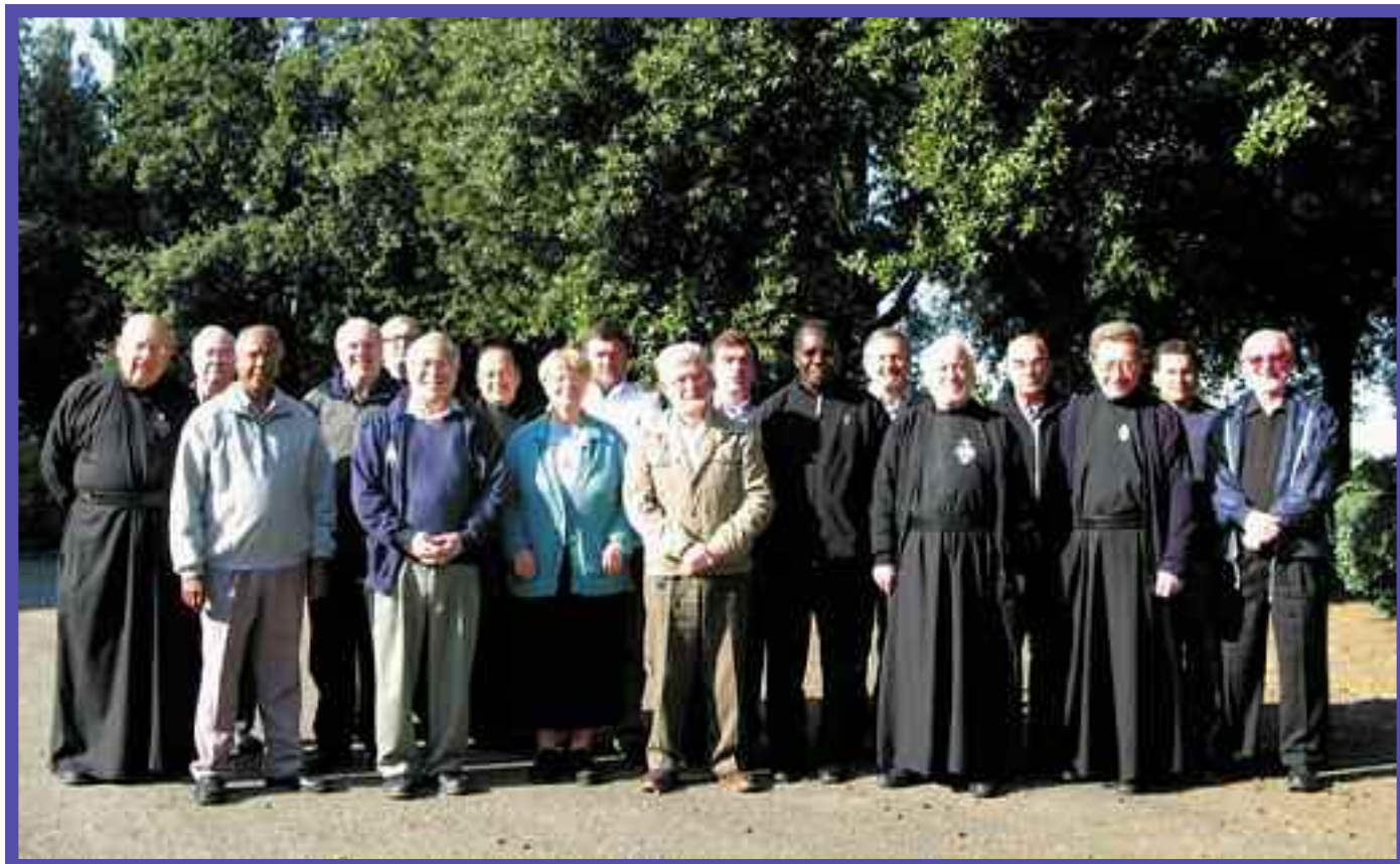
El Superior General, la Curia General, los Coordinadores de las Configuraciones y el personal

La próxima reunión será en junio de 2009, cuando los coordinadores presenten sus reportes sobre este trabajo. Otra reunión está pautada para los días del 2 al 4 de diciembre de 2009 en Roma.