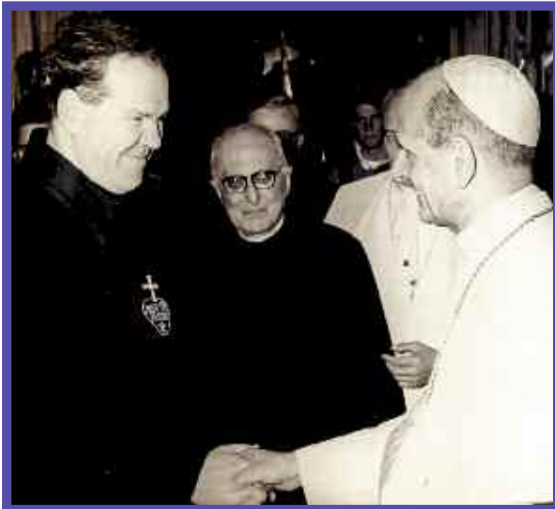
P. Theodore Foley, Superior General y el Papa Pablo VI

Documento Capitular nacido del Capítulo General de junio de 1970.