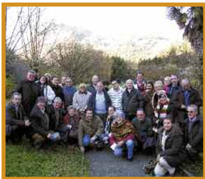
Religiosos y laicos de la Familia Pasionista en la Asamblea Provincial 2008 de la Provincia SANG, España

En el discurso de apertura, el Provincial y su Consejo invitaron a los participantes a reflexionar en sus comunidades y las distintas comisiones sirviéndose de tres tópicos: 1. Revisar el Plan Provincial para los años del 2005-2009; 2. Incorporación y asimilación del proceso de Reestructuración; Discernimiento a la luz del próximo Capítulo Provincial (27-31 de julio de 2009). Él sugirió que la Asamblea tomara como fuente de inspiración para la actividad pastoral y misionera de la Provincia las reflexiones del reciente Sínodo de Obispos: “Para fortalecer la práctica del reencuentro con la Palabra de Dios como fuente de Vida”.