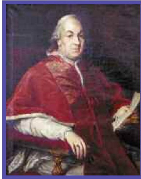
Papa Pío VI (1717-1799)

tes. El nuevo texto, así elaborado, fue aprobado por Pío VI en septiembre de 1775, mediante la bula Praeclara virtutum exempla .