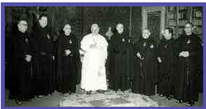
Papa Juan XXIII, P. Malcolm La Velle (Superior General) y miembros de la Curia general, 1959

En 1950 se celebró un congreso internacional de los “Estados de Perfección” en el que se expresó la necesidad de ulteriores adaptaciones de las reglas y constituciones de los diversos institutos religiosos. Nuestro Capítulo General de 1952 decidió confiar a una comisión el estudio de estas adaptaciones. El trabajo duró hasta 1959. Los puntos deseados estaban conectados con una mayor implicación de la base en los capítulos provinciales, la preparación de los formadores y el estudio del fenómeno (en aumento) de las pequeñas comunidades. Fueron instituidas las “asistencias”, fue aumentado el número de los consultores en las provincias, se dispuso la elección de delegados tanto para los capítulos generales como para los capítulos provinciales. Las casas fueron diferenciadas por finalidad y consistencia. Junto a otros puntos, esta nueva configuración fue presentada por el superior general, P. Malcom La Velle, a la S.C.R., después de las necesarias revisiones, y fue aprobada el 1º de julio de 1959.