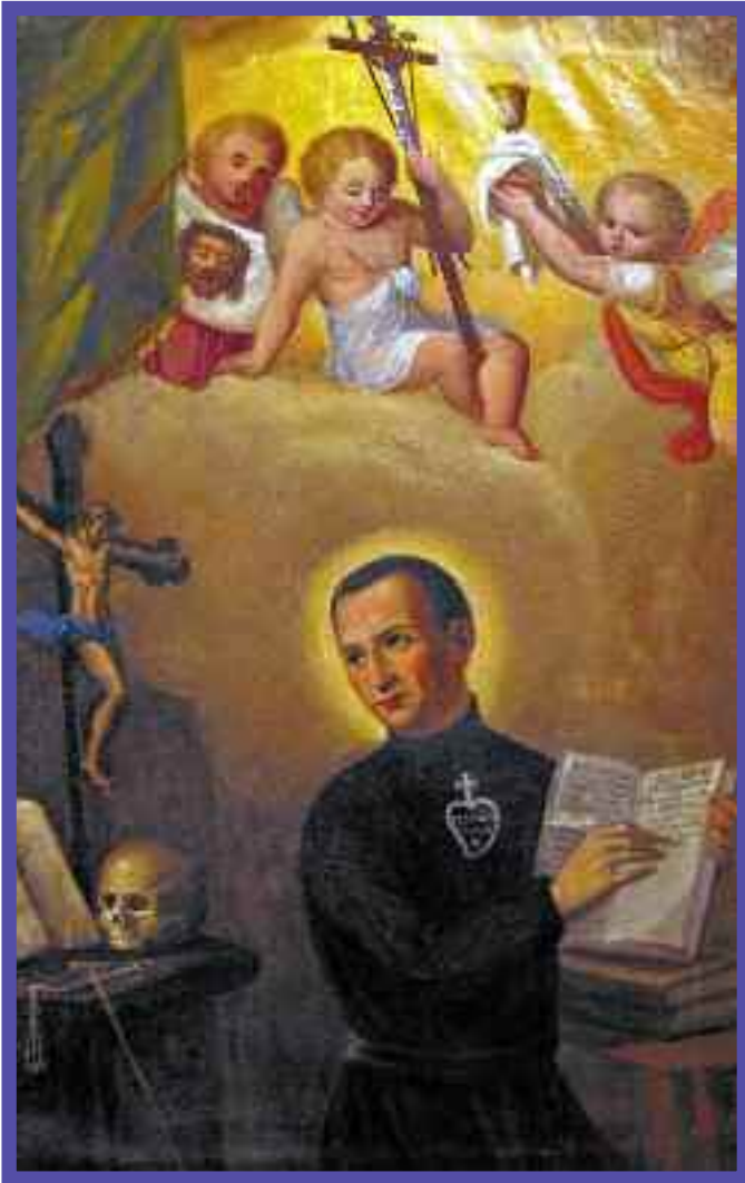
San Pablo de la Cruz escribiendo el primer borrador de las Reglas en Castellazzo

referimos al valle del mundo en todos los tiempos, y de esto agradecemos a Dios porque todo es don suyo.