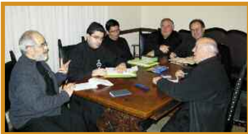
Religiosos que participaron al taller sobre el apostolado en Italia