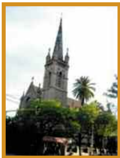
La iglesia de la Santa Cruz, Buenos Aires, Argentina

El gobierno nacional declaró monumento histórico a la Iglesia de la Santa Cruz, uno de los edificios más emblemáticos de la resistencia a la dictadura militar que fue lugar de encuentro de madres y familiares de secuestrados para intercambiar información y organizarse en la búsqueda de sus seres queridos.