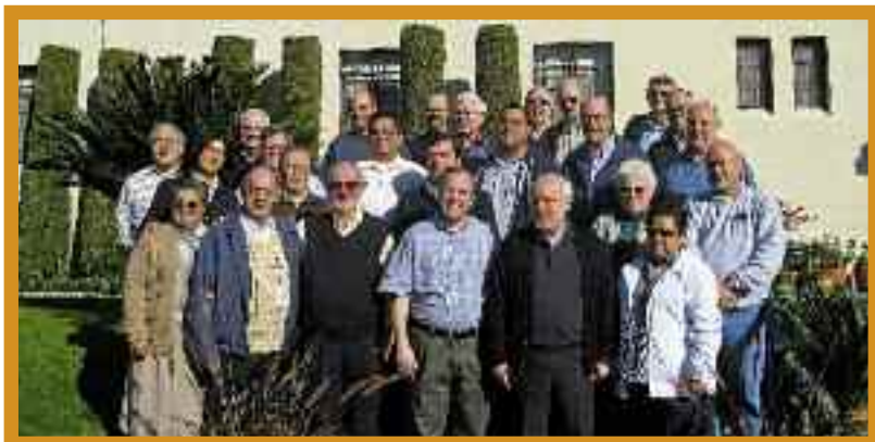
El Superior General y la Curia General al encuentro interprovincial en los Estados Unidos

En conclusión, se tuvo un sentimiento muy positivo de este encuentro. A esta experiencia se añaden importantes elementos para la primera reunión de la nueva configuración de Cristo Crucificado que se celebrará en abril del 2009.