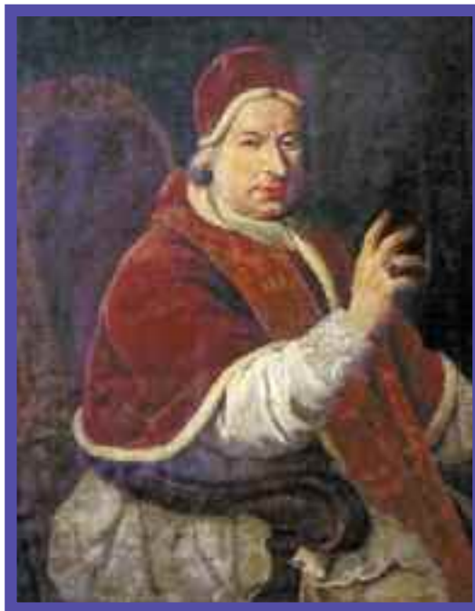
Papa Benedicto XIV (1675-1758)

Así, llegó la aprobación de la Regla, más no del instituto, el 18 de abril de 1746, pero con significativos pasos adelante con respecto al rescripto anterior. Esta vez se trataba de un breve con concesiones que consolaban a Pablo y a sus compañeros, pero animaban