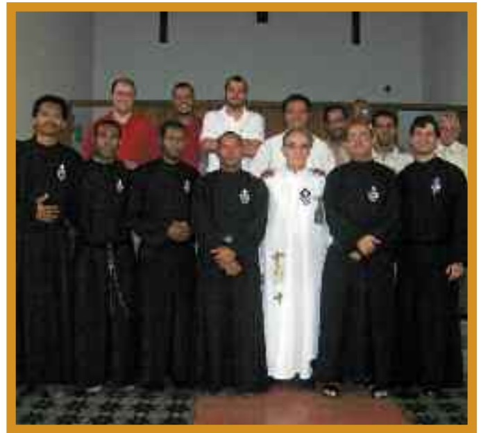
Participantes a la Asamblea del Vicariato PRAES-DOMIN del Brasil

Los religiosos del Vicariato del Beato Domingo de la Madre de Dios se reunieron en la ciudad de Jequié, Bahía, Brasil durante los días del 6 al 9 de enero del 2009 para su asamblea anual.