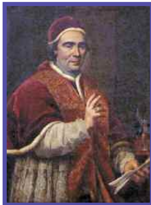
Papa Clemente XIV (1705-1775)