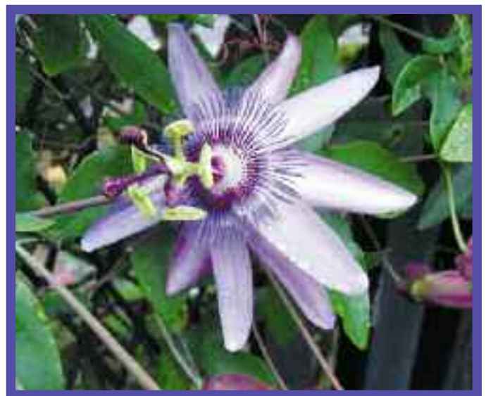
“Soledad, silencio, pobreza, desprendimiento y la penitencia además, naturalmente de la oración y la meditación, son el hábitat en el cual se cultiva y florece la flor de la Pasión.”

En la Carta Circular a la Congregación del 15 de abril de 1985 con motivo de la publicación de las Constituciones, Mons. Paul Boyle entonces Superior General, escribía: “El 12 de marzo de 1984, fiesta de la Conmemoración Solemne de la Pasión, han sido aprobadas formalmente nuestras nuevas Constituciones, como expresión auténtica de nuestro carisma y de nues-