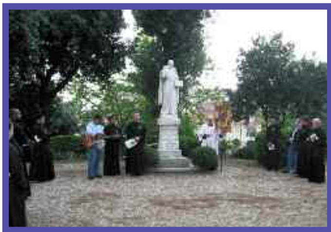
“La nuestra actividad Apostólica es expresión de la vida comunitaria”. (Const. N. 67). Jardín de los Santos Juan y Pablo en Roma

Para que la expresión textual de un patrimonio espiritual sea auténtica y compartida al interno de una concepción comprendida y consciente -incluso como transmisión histórico-espiritual en el tiempo- hace falta que tenga cualidades que le sirvan de control y verificación. Estas cualidades son: la unidad inspirativa, es decir, la coherencia interior; la propiedad , es decir, la identidad original al interior de la secuela Christi (recordada por PC como criterio último) que no asuma proyectos y aventuras en contraste con la inspiración fundante; en fin, la funcionalidad , es decir, aquella fuerza operativa y productiva que responde a reales cuestiones eclesiales. Las Constituciones reflejan y recobran el espíritu de las antiguas Reglas porque tienen las cualidades descritas. A este respecto, algunos números son como pilares que soportan el armazón de la configuración de nuestra congregación, en el curso de una conciencia comunitaria que se ha madurado, poseído y transmitido con un texto.