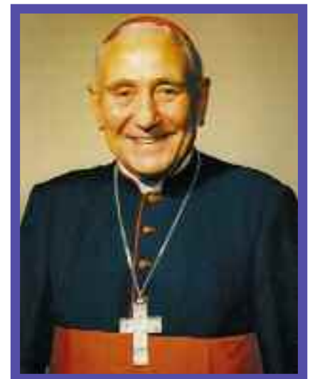
Eduardo Cardinal Pironio (1920-1998)

Decreto de aprobación de las Reglas de 1984