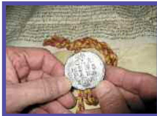
La Bula “Supremi Apostolatus” de 1769 con la cual los Pasionistas fueron reconocidos como Congregación de Derecho Pontificio

En el despliegue de las fuerzas eclesiales, nuestra Congregación ha tenido un sitio y un papel histórico que ha cobrado confianza y resonancia. Esto debe decirse con humildad, porque hemos escrito páginas históricas de intensa vida cristiana, con fuerzas exiguas, pero con existencias excepcionales entregadas al sacrificio y al anuncio, lo que ha codificado la Regla del Fundador y que se han propuesto nuevamente las Constituciones aprobadas por la Iglesia en 1984.