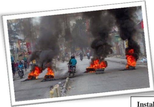
Instalan barricadas con llantas en llamas en lugares estratégicos de la capital, Puerto Príncipe, ya que las oposiciones exigen la salida del actual gobierno.

Durante 2020, el país experimentó una rápida depreciación de la moneda y una inflación galopante. El dólar estadounidense perdió el 40 por ciento de su valor en el país. No se rebajó el precio de la gasolina, el diésel y los alimentos