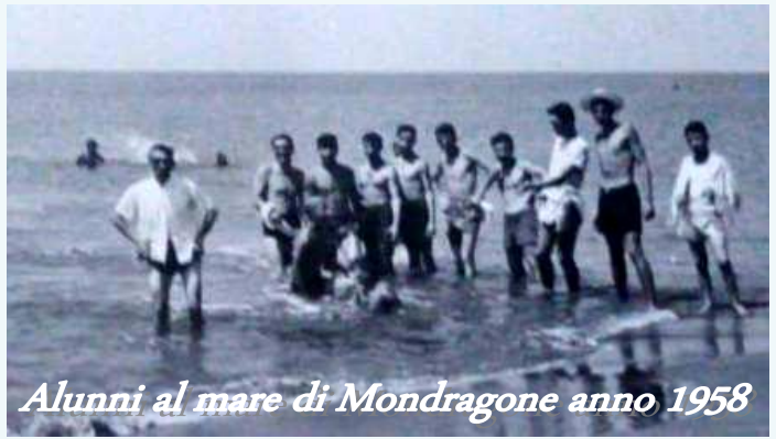
Alunni al mare di Mondragone anno 1958

commentandole adeguatamente con viva partecipazione, da far invidia ai noti opinionisti sportivi. Indimenticabile, poi, quando, da attore consumato, ci leggeva delle pagine di Guareschi, imitando Don Camillo e l'on/le Peppone, o quando ci deliziava con brani della letteratura italiana tratti da “Pian dei Giullari” di Piero Bargellini. L'ultima volta che l'ho incontrato è stato in occasione del secondo raduno aseap del 26 giugno 1991, organizzato a Calvi Risorta.